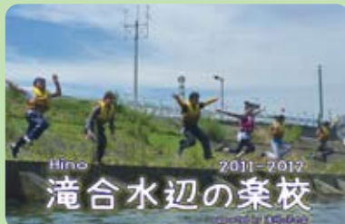
Hino 2011-2012 滝合水辺の楽校