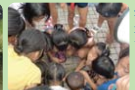
ガサガサ取れました