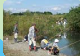
平成22年度魚釣り入門の風景