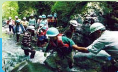
源流体験～真剣に渡渉

4月に立川市の「たちかわ環境賞」の大賞を受賞。様々な機会に協力などして下さっているみなさんと共に、立川の環境団体の連携のためのリーフレットを作成しました。