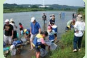
平成22年度魚釣り大会の風景

今年からはカヌー教室も開催され、自然と触れ合う楽しさを満喫できるようなイベントを考えています。